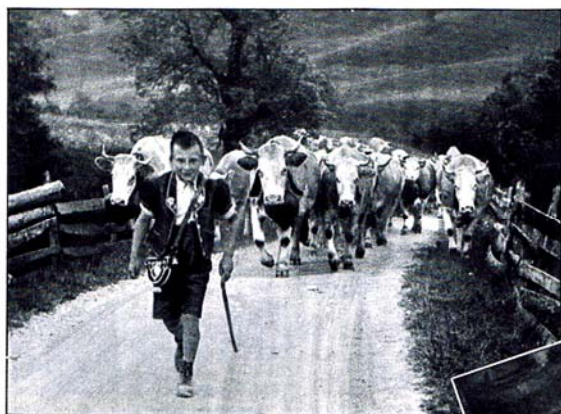
Le troupeau monte, mené par le plus jeune armailli.