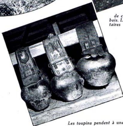
Les toupins pendent à une poutre, dans la grange.

C'est en Gruyère qu'il faut voir le départ des armaillis. Dans leurs beaux costumes, caractéristiques de la région de Bulle et du Jaunpass, poussant leurs troupeaux aux lourdes et riches sonnailles, ils montent vers les grands pâturages où les attendent les chalets rustiques aux toits immenses. Le plus jeune armailli conduit le troupeau. Derrière, sur un char, puis à dos d'homme, on transporte le grand chaudron, où, tout l'été, les armaillis prépareront le bon fromage de Gruyère.