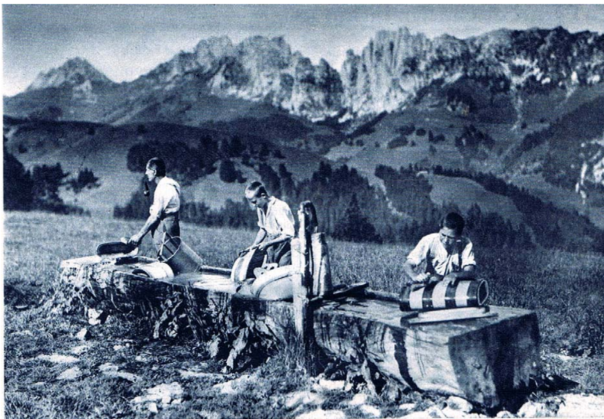
Le labeur quotidien des armaillis.