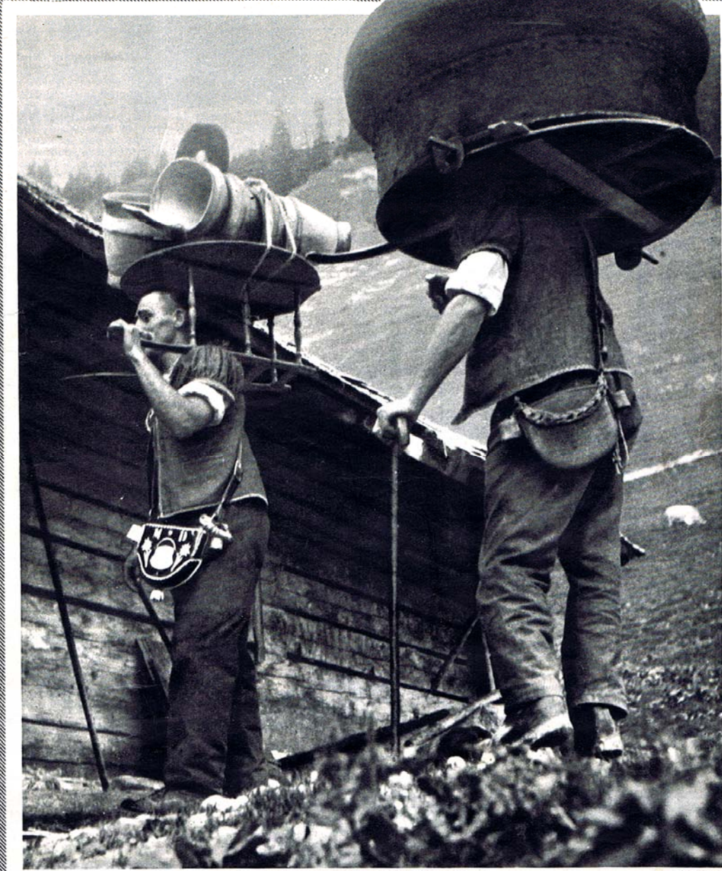
Les fromagers arrivent au chalet.