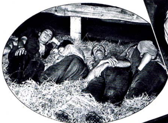
Première nuit sur la paille.

La dernière neige a fondu sur les pentes des alpages. Le moment est venu, pour les armaillis de regagner les hauts chalets où ils passeront l'été avec les troupeaux. On a préparé les ustensiles nécessaires, on les a chargés, le pittoresque cortège se met en marche.