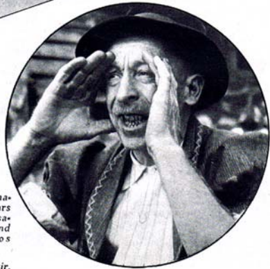
A droite : You-héé ! De nouveau, dans ces lieux, l'appel de l'Alpe vient de retentir.